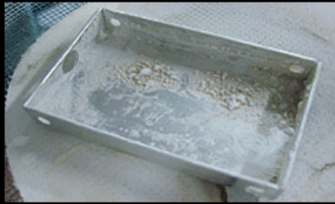
他社高性能クーラント (不凍効果なし、エチレングリコール) 粘土状のようなスラッジが発生しました。