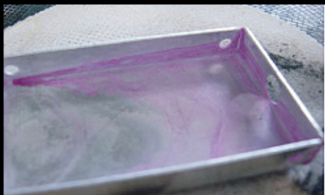
C72 SUPER COOLING LIQUID パープルの色素だけが残りしました。

この実験は各クーラントをアルミケースに入れ、熱を加え、蒸発後の状態を見たものです。この実験の状態はエンジン内部が高温になった状態と置き換えられます。