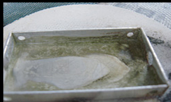
他社純正相当品 (不凍効果有、エチレングリコール) 緑の色素と黒いスラッジが混ざり合っています。